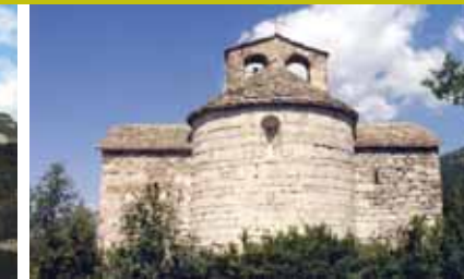
Sant Pere d'Aüira / Miquel Serrador