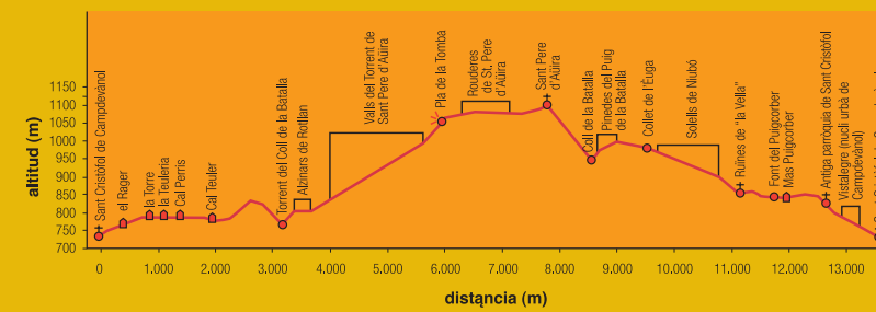
Pendent de l'itinerari de Sant Pere d'Aüira